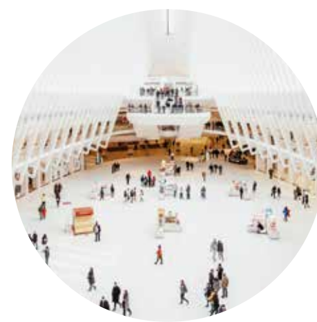
Barrer grandes extensiones